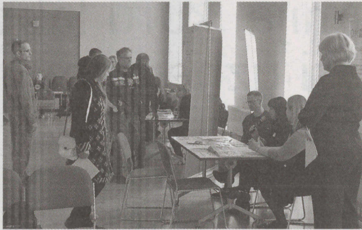
◆ IZZINA DARBA IESPĒJAS. Vakanču gadatirgū Cēsīs par darba iespējām interesējās jaunieši, jaunās māmiņas, cilvēki, kuri pēkšņi palikuši bez darba vai ir pirmspensijas vecumā, tāpat arī ilgstošie bezdarbnieki.