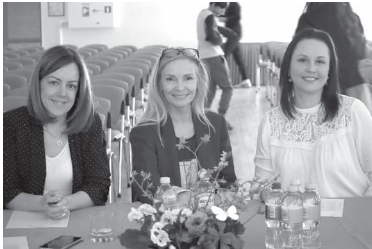
Vokālo varēšanu konkursā vērtēja «Kandavas dāmu grupas» dāmas