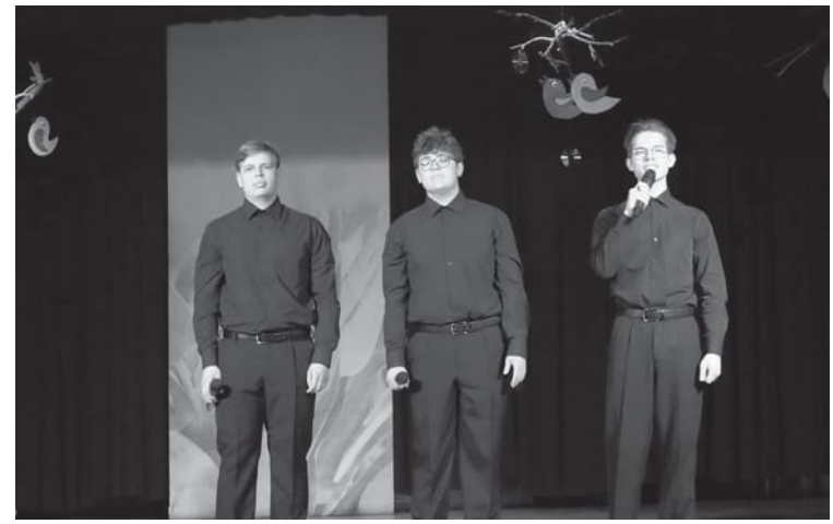
Tehnikuma konkursā varēja uzstāties gan kā solists, gan muzicēt lielākās vienībās

Šodien, 17. aprīlī, Kandavas tehnikumā Atvērto durvju diena. Topošajiem audzēkņiem tā ir iespēja tuvāk iepazīties ar izglītības iestādes programmām un sniegtajām iespējām. Bet arī bez tā šī nedēļa te bijusi īpaši darbīga.