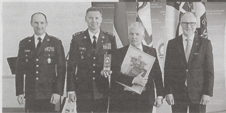
SIA PCЭЗ «Веремс» номинант категории «Мотиватор».

Подчеркивая особый вклад в поддержку Земессардзе в 2025 году, Почетную грамоту и деревянную статуэтку Министерства обороны получили 11 номинантов в девяти категориях: