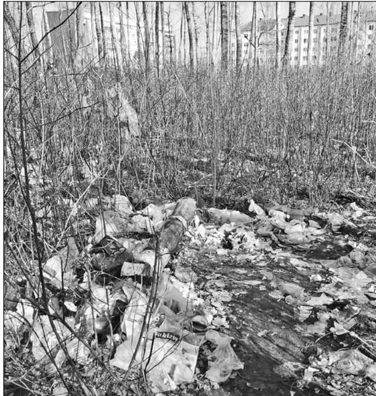
BEZATBILDĪBAS REZULTĀTS — IZGĀZTUVE! Aizkrauklē, bērzu birzītē kāds tišuprāt atbrivojas no atkritumiem.