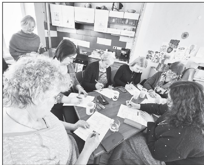
Dalībnieki tikšanos vērtē ļoti atzinīgi un gaida nākamās.