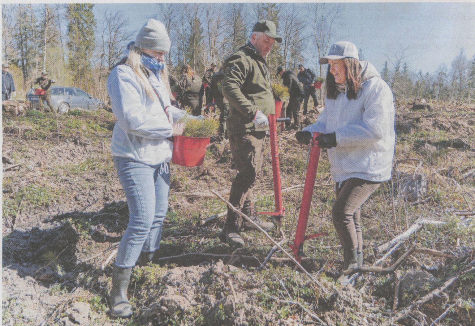
23. aprīlī netālu no Kamparkalna ikkatrs «Piemiņas meža» priekš koka stādīšņ zemē ievietots ar komandas darbu.