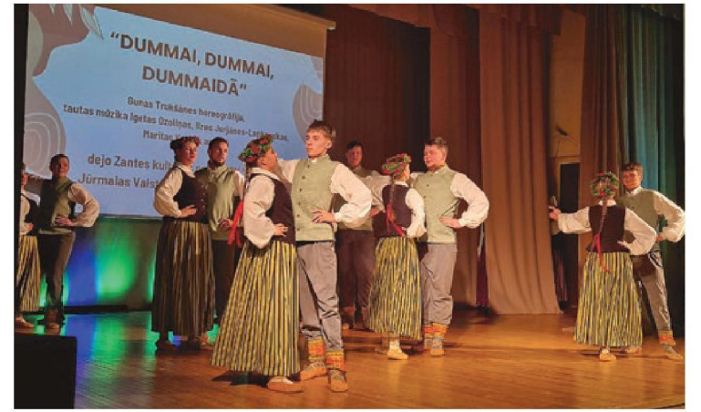
Zantes jauniešu deju kolektīvs "Sīpa" pasākumā "Iedejojām pavasari Zantē".

tistikas informācijas uzklaušanās tika prezentēti arī Zemītes pagasta iedzīvotāju aptaujas rezultāti. Tie atspoguļoja iedzīvotāju apmierinātību ar pašvaldības pakalpojumiem, esošo nodrošinājumu, kā arī iedzīvotāju vajadzības un viedokļus par nepieciešamajiem uzlabojumiem pagasta attīstībai nākotnē.